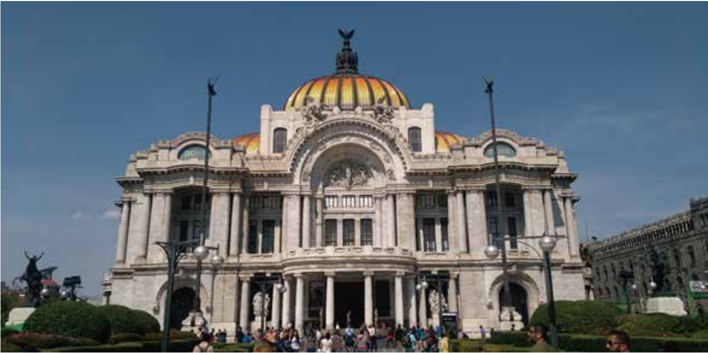
사진9: 황금빛 돔과 하얀 대리석의 조화가 아름다운 팔라시오 데 베야스 아르떼스

멋진 기회가 될 거 같아 가보고 싶었는데 입장료가 너무 비싸서 눈물을 머금고 포기하긴 했지만 말이다.