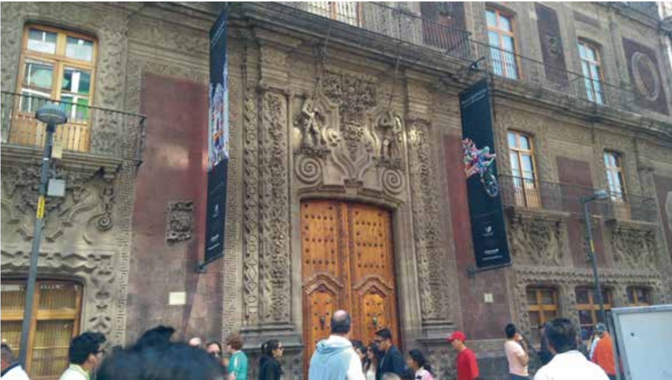
사진5: 시티바나멕스 문화회관으로 이름을 바꾼 이푸르비테의 옛 궁전 입구

이름도 다시 시티바나멕스 문화 회관이 되었다. 물론 우리는 이 멋없는 새 이름을 좋아하지는 않는다.