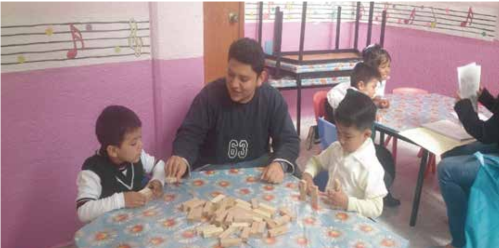
사진 3: 이베로아메리카나 대학교의 심리학과에서는 시내 유명 병원이나 학교, 어린이집 등에서 진행되는 수준 높은 실습 수업도 제공한다.

있다. 장학금을 줄 때는 학생의 실력, 그리고 경제적 상황을 고려해 종합적으로 봤을 때 꼭 장학금 혜택이 필요하다고 판단될 경우 지급한다. 그리고 나, 베라크루스 주의 농촌 출신에 가진 것 없는 내가 여기 이 부유한 세계에 들어와 공부할 수 있게 된 것도 장학생 심사에 합격했기 때문이다.