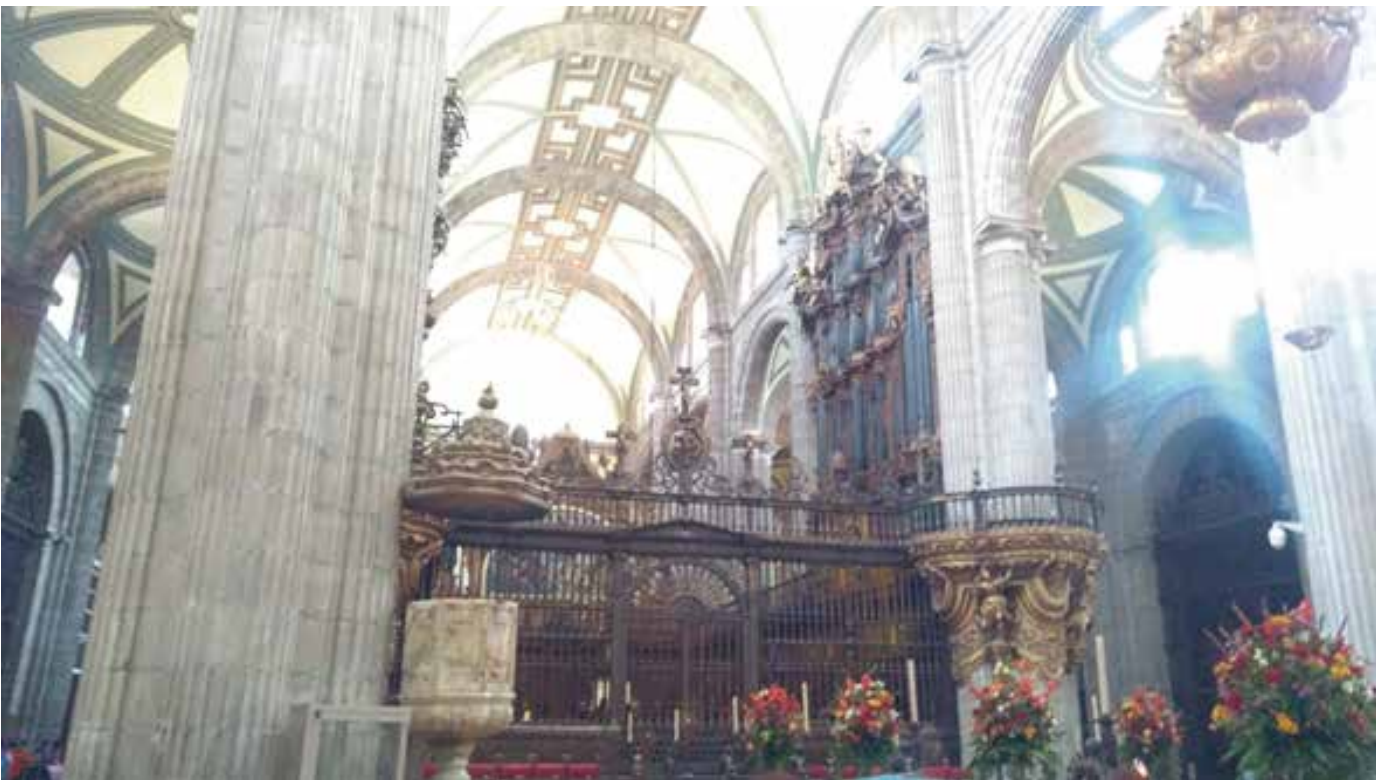
사진4: 대성당의 명물이자 역사적 유물과도 같은 파이프 오르간

어린 내 눈에 북적북적 많은 사람들과 성당 내부의 곳곳에서 번쩍번쩍 빛을 내는 황금 장식들, 엄청나게 굵은 돌기둥들 등에 놀라 입을 다물지 못했다. 하지만 무엇보다 내 눈길을 끌었던 것은 거대한 파이프 오르간들로, 이백년 전 18세기에 만들어진 두 개의 오르간이 6000개가 넘는 금속관을 거느린 채 위용을 자랑하고 있다.