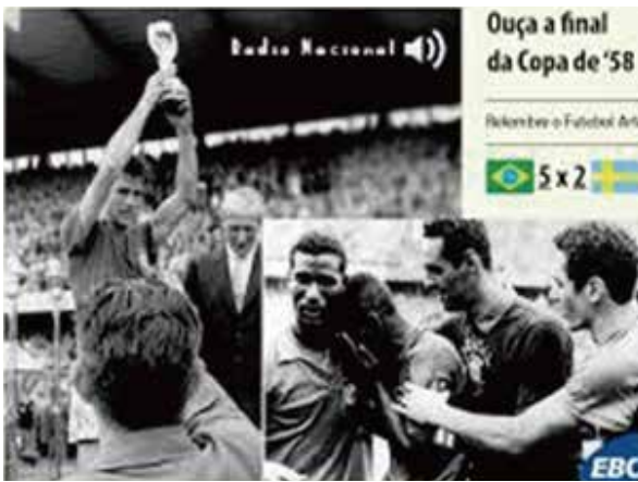
그림. 브라질은 1958년 처음으로 월드컵에서 우승한다. 축구황제 펠레가 기쁨의 눈물을 흘리고 있다.

위대한 브라질을 만들겠다는 JK의 꿈은 신수도 브라질리아 건설로 정점을 찍는다. 내륙 오지에 한 나라의 수도를 새로 건설하는 것은 무에서 유를 창조하는 일이었다. JK가 자신의 꿈을 발표했을 때 실현 가능성을 믿는 사람은 거의 없었다. 하지만 그는 불가능을 가능하게 만들어냈다. 1960년 4월 21일