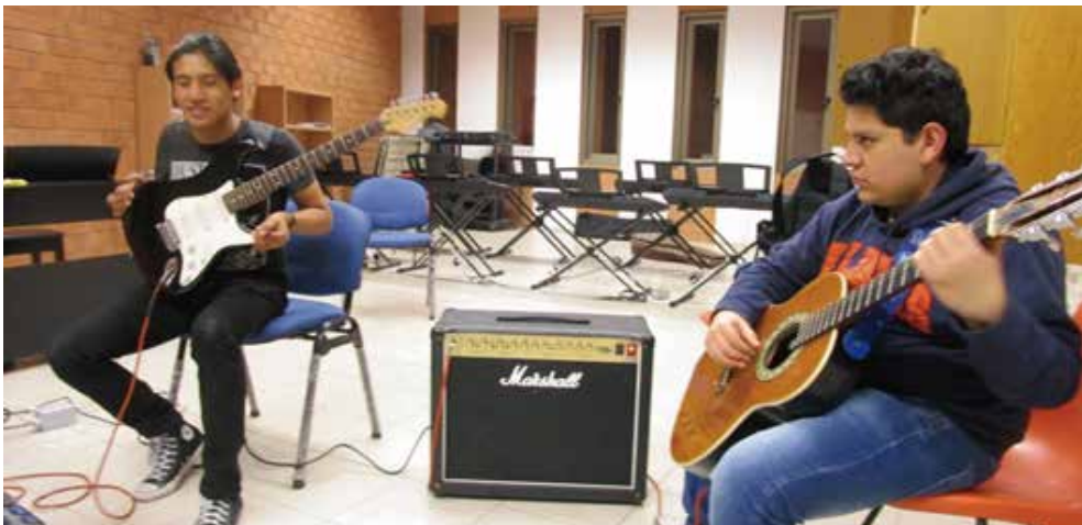
사진5: 학교 구성원들 모두가 수강 가능한 음악 교실과 음악 전용 강의실

학교의 수업은 아침 7시에 첫 수업이 시작돼 밤 10시에 마지막 수업이 끝난다. 아침 7시 수업을 들으려면 겨울의 경우 입에서 김이 나올 정도로 추울 때에 하늘의 달과 별을 보며 학교에 도착해야 한다. 수업 시간은 조절할 수 있지만 필수 과목의 경우 아침 7시든 밤 마지막 수업이든 들어야 하고 당연히 공장 시간이 많은데, 그럴 때면 학교가 무료로 제공하는 각종 서비스를 활용하면 된다.