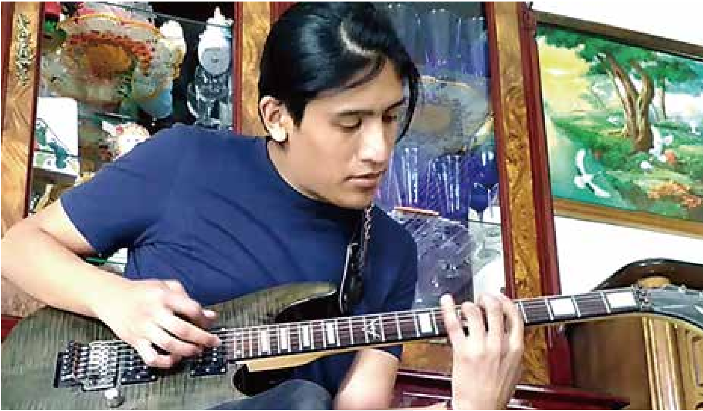
사진7: 볼리바르 거리는 악기 상점 거리로 유명해 기타를 고르거나 쳐 볼 수 있다.