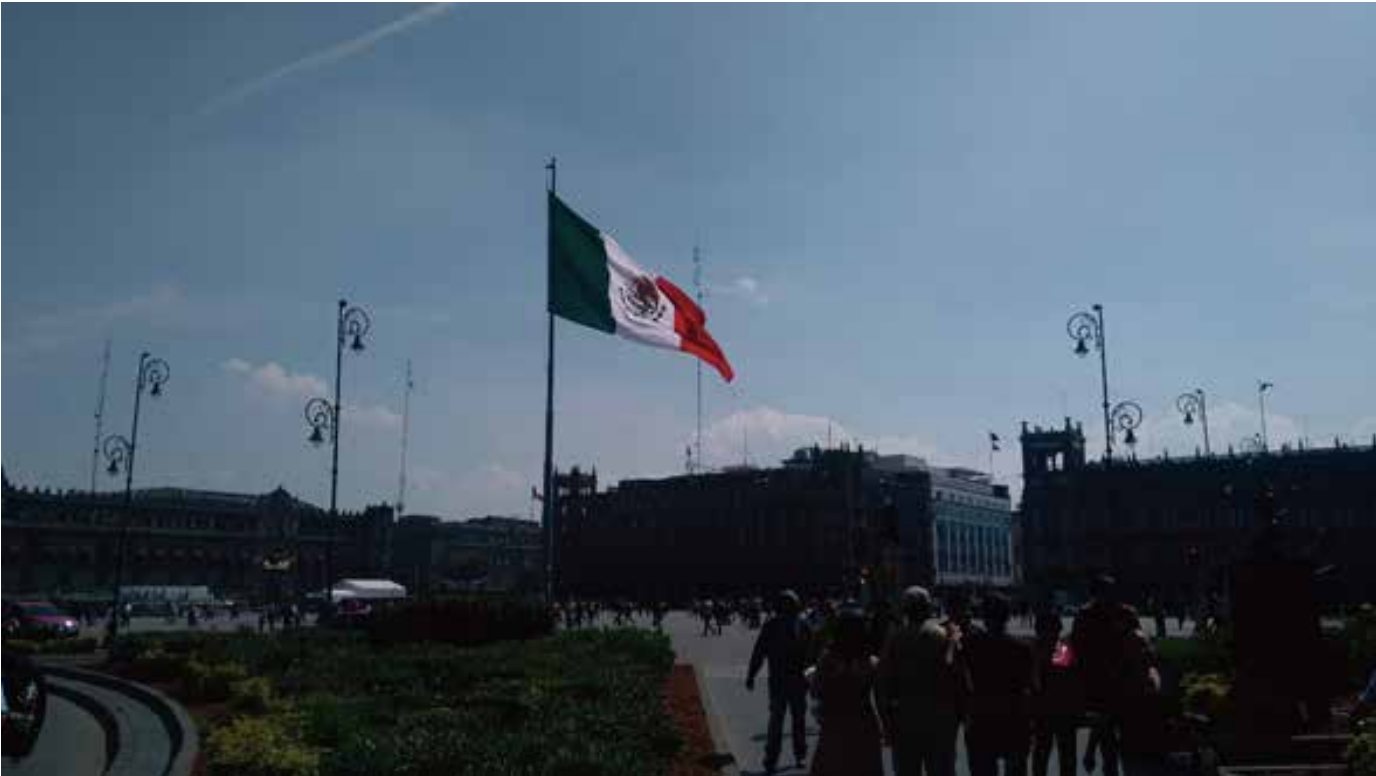
사진1: 멕시코시티 역사지구의 핵심 소칼로(Zócalo) 광장

떼노츠띠플란이 건설된 14세기초부터 거의 700년간, 기나긴 역사의 시간 동안 바로 여기서 아스테카 제국이 건설되었다가 멸망했고, 그렇게 스페인 군이 입성했고, 또 이후 멕시코 독립군들이 들어왔으며, 멕시코-미국 전쟁 때는 미국이 내정 간섭을 하러 군을 끌고 들어왔고, 자유주의자였던 베니토 후아레스 대통령이