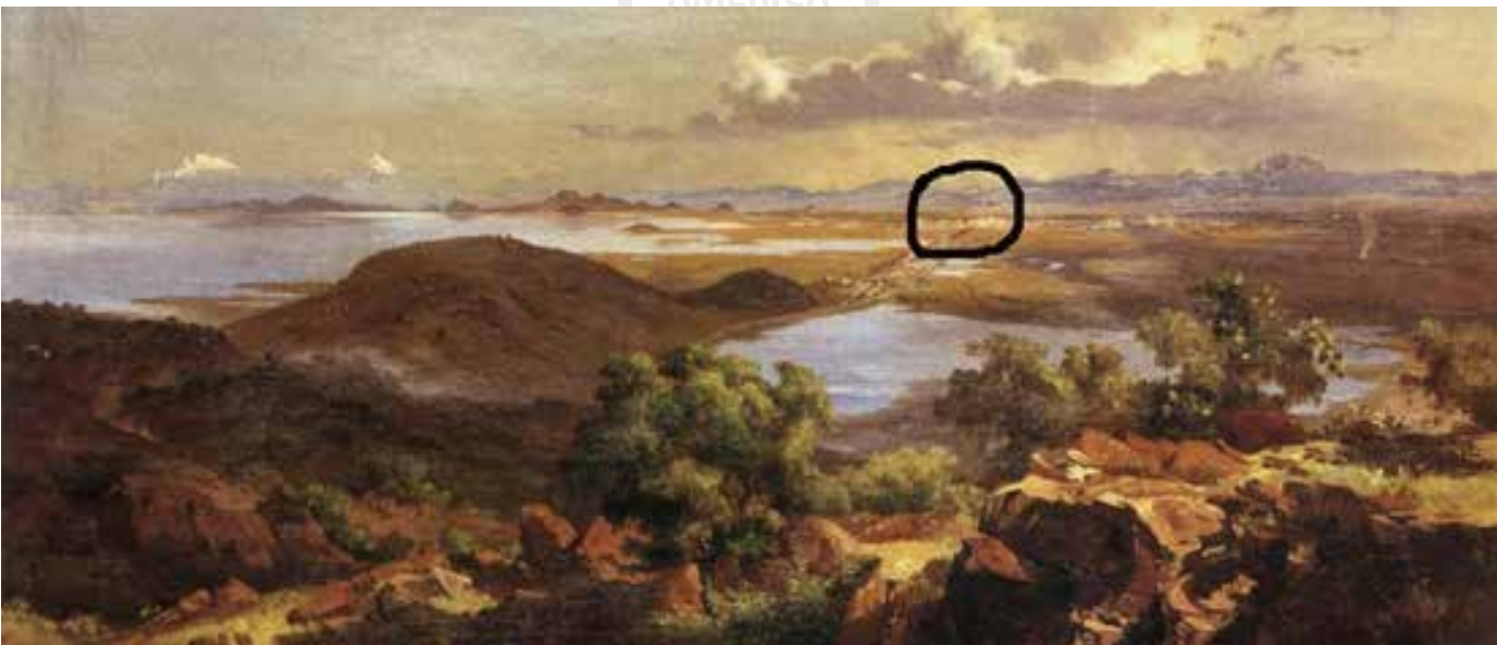
사진6: 벨라스코의 그림 “산타 이사벨 언덕에서 본 바예 데 멕시코 풍경” (1875). 동그라미 쳐진 곳이 오늘날 역사지구이다.

벨라스코는 멕시코의 문명이 탄생한 ‘바예 데 멕시코(Valle de México, 멕시코의 계곡이란 뜻)’를 주로 그렸다. 그의 그림을 보면 우리가 살고 있는 이곳,