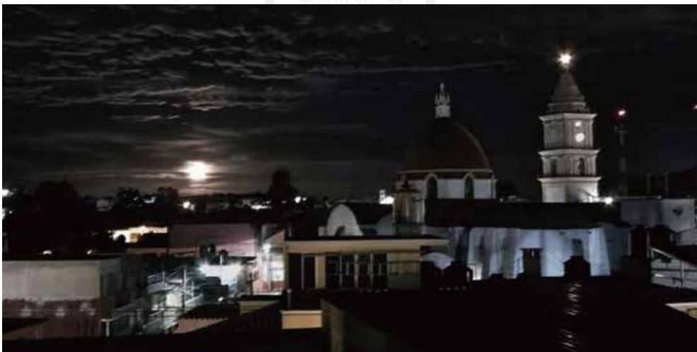
사진6: 늘 그리운 나의 고향의 소도시 라스 비가스 데 라미레스 (Las Vigas de Ramírez). 지금 내가 살고 있는 멕시코시티의 산타 페 지구와는 너무나 대조되는, 멕시코의 또 다른 부분이다.

보이기도 한다. 그러나 나의 한쪽 발은 여전히 가난함의 세계를 밟고 있다. 아니 가난함과 싸우고 있다. 가면 갈수록 생활비 부담이 늘어 돈을 벌어야 하는데 장학생은 휴학을 할 수도 없다. 무조건 4년 8학기 수업을 연달아 이수해야 한다. 학점도 평균 8.8이상(10점이 A+)을 유지해야 한다. 이 부유한 학교에 들어앉아서 저녁끼니를 이을 수 있을지 빈 지갑을 뒤지며 걱정해야 하는 아이러니 속에서 다행히 도움의 손길이 뻗었으니, 학교 안의 신경 심리학 실험실과 신경학 연구 프로젝트의 일을 연계된 것이다. 덕분에 근근이버티게는 되었지만 부유함과 가난함의 경계에서