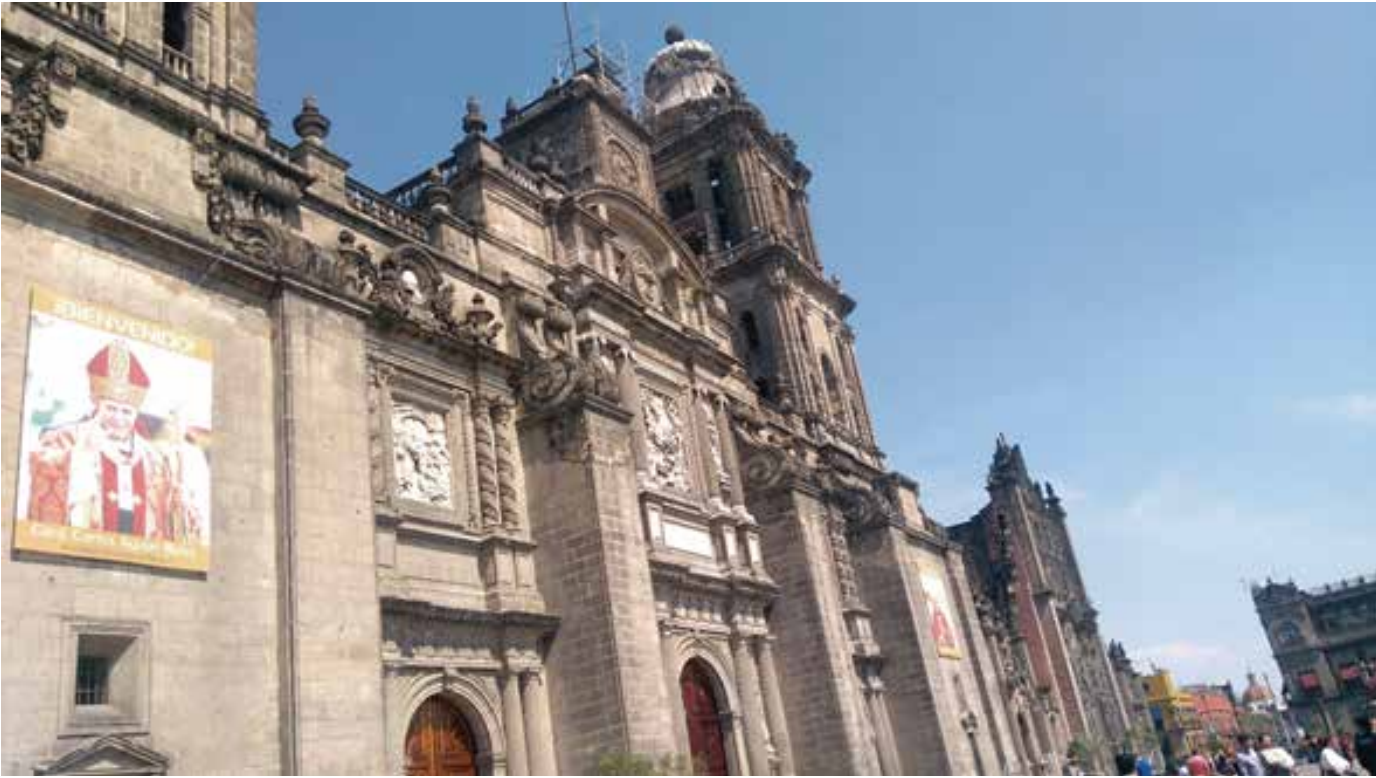
사진3: 소칼로 광장의 가장자리에 있는 대성당의 정문

고딕양식, 바로크 양식, 신고전주의 양식 등등, 스페인의 식민 시대였기 때문에 유럽의 양식들이 주가 되지만 그 속에서 또한 원주민 석공들의 독특한 표현들도 살아 있다. 개인적으로 나는 여섯살 즈음에 어머니 손을 잡고 처음으로 대성당 문턱을 넘었는데,