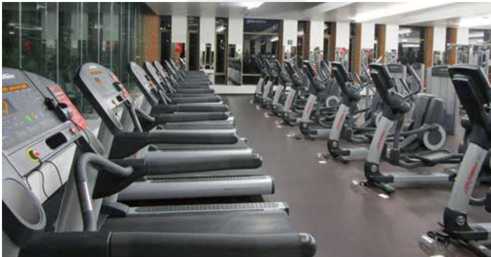
사진4: 이베로 공동체 (학생-교수-직원-졸업생) 일원들 모두가 사용 가능한 헬스장

그러나 감격도 잠시, 이 학교는 먼저 내 고향으로부터 너무나 먼 곳에 있었다. 그리고 등록금이 면제된다 한들 멕시코시티에서의 생활비는 어떻게 해결할 것인가? 게다가 학교가 위치한 산타 페 지구는 대기업에 근무하는 직원들이 주로 사는 부자 동네라 월세도 어마어마하다. 대학 기숙사는 없다. 하지만 이 좋은