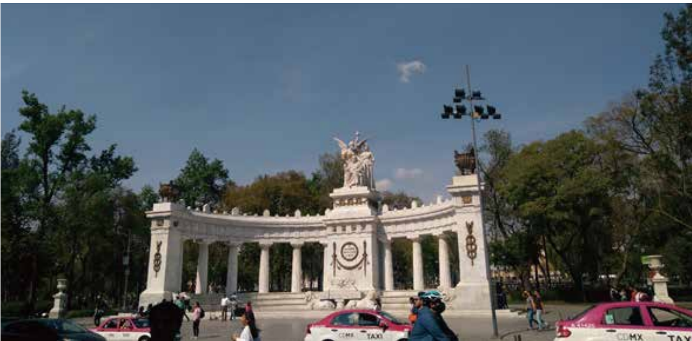
사진2: 베니또 후아레스 전 대통령을 기념하는 반원 아치(Hemiciclo a Juárez), 알라메다 센트랄 공원에 있다.

서거했으며 또 멕시코 혁명 때는 술한 사람들이 피를 뿌렸던 곳이 지금 우리가 딛고 있는 이 땅이다. 그뿐만 아니라 현재 멕시코국립 자치 대학(UNAM)의 모태가 된 산 일데폰소 학교와 아름다운 오페라 하우스이자 미술관인 빨라시오 데 베야스 아르떼스(Palacio de Bellas Artes, 이하 베야스 아르떼스), 그리고 스무개가 넘는 미술관 등 문화적으로도 꼭 짚고 넘어가야 할 곳이다.