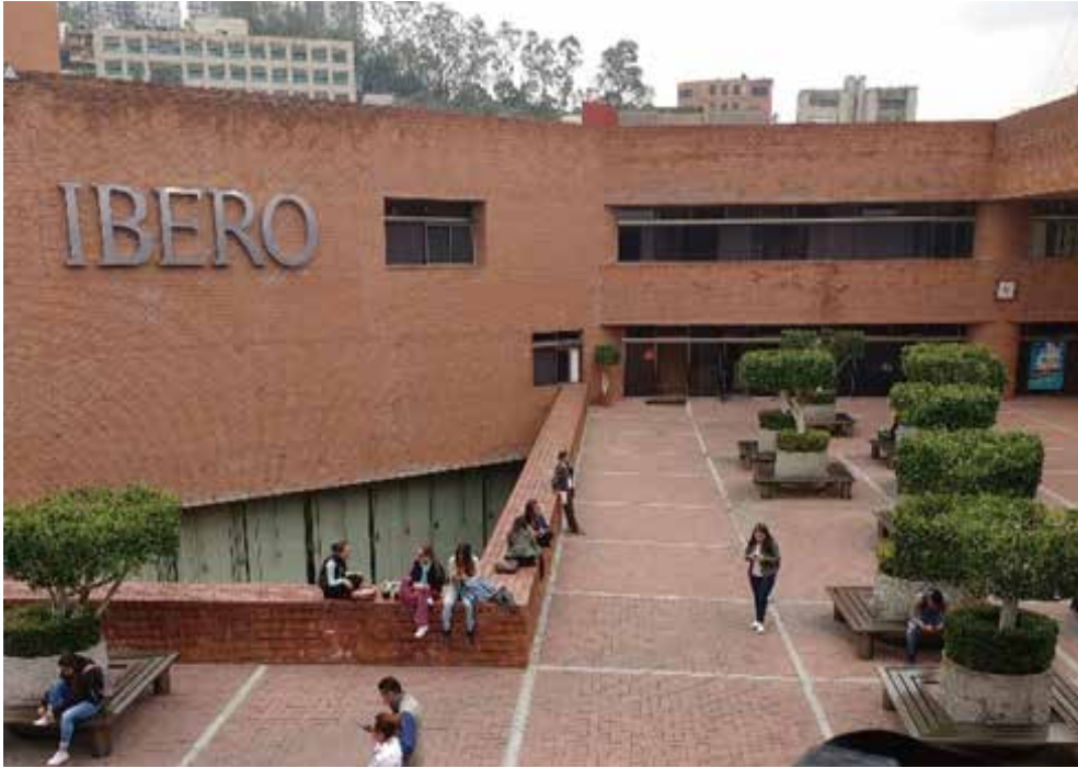
사진1: 줄여서 ‘이베로’라고 부르는 멕시코시티의 사립 대학교 이베로아메리카나 (Universidad Iberoamericana)