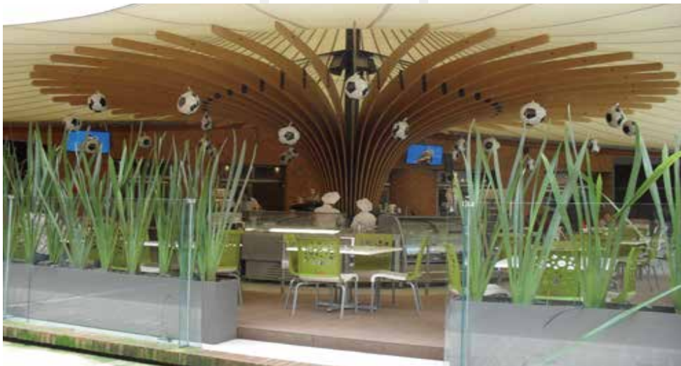
사진2: 교내 식당 까르빠(K-rpa). 가격이 좀 비싼 편이다.

학교로 멕시코시티 외곽의 신흥 상업 지구인 산타 페 지역에 있다. 그리고 띠후아나와 뿌에블라, 레온 등 지방 캠퍼스도 존재한다. 멕시코시티 본교의 경우 부속 고등학교에서부터 전문대, 학사, 석사, 박사 과정까지 모두 갖추고 있다. 그리고 등록금이 비싼 걸로 치면 우리나라에서 몇 손가락 안에 들어가는 사립대이기도 하다. 그만큼 학교의 시설과 서비스도 좋고, ‘명문’이라 불릴만한 명성도 갖추었으니 아마도 이 비싼 학교에 캠퍼스가 미어 터질 정도로 학생이 많은 것이 아닐까 싶긴 하다, 다들 점심을 먹는 오후 2시~4시 사이엔 교내 식당에 자리를 잡기가 힘들 정도니까.