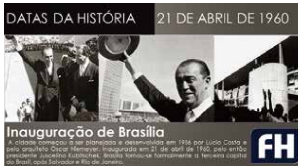
그림. 브라질리아 준공 기념식 당시 주셀리누 쿠비체크 대통령.

JK 행정부가 새로 건설한 도로의 총 길이는 1만 8000 Km에 달한다. 푸르나스와 트레스마리아스 등 대규모 수력발전소 2기를 만들어 가동시켰다. 브라질 제조업 분야의 생산능력은 80%나 성장했다. 브라질에서 자동차 생산을 시작한 것도 이때부터다. JK 임기 동안 무려 600%나 성장한 자동차 산업 덕분에 수많은 브라질 중산층 시민들이 자동차를 구입해 전국을 여행할 수 있게 되었다.