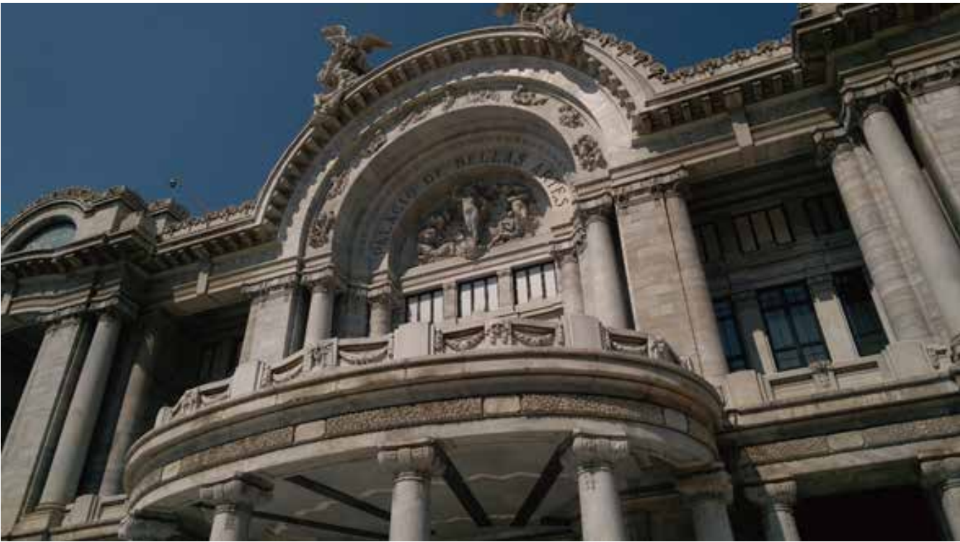
사진8: 팔라시오 데 베야스 아르떼스 (Palacio de Bellas Artes) 정면의 비너스상

표기된 지하철 2호선의 베야스 아르떼스 역에 내리면 바로 도착할 수 있다. 멕시코 예술계에 있어 가장 중요한 공연장이라고 단언할 수 있는 베야스 아르떼스는 멕시코 혁명을 유발시킨 독재자 포르피리오 디아스 정권 때인 1904년에 건축이 시작돼 혁명의 소용돌이를 거쳐 점차 혁명이 정리되어 가던 1934년에 완공되었다. 그래서 19세기말-20세기 초의 아르누보와 1920~30년대 아르데코 양식이 하얀 대리석 건물