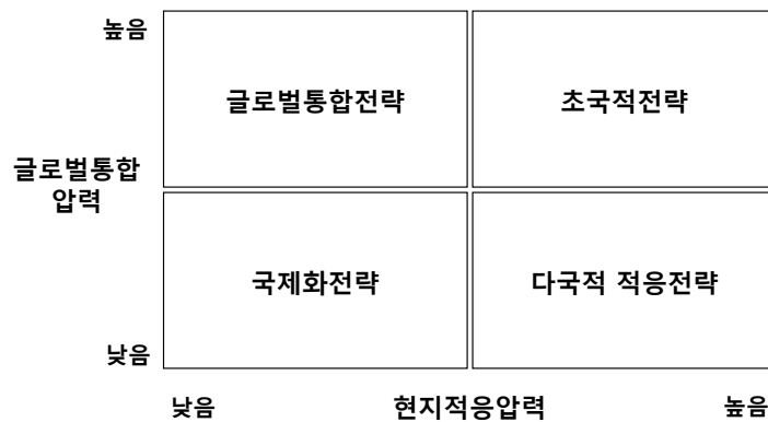
[그림 2] 초국적모델(Transnational Model)

고, 이러한 현지적응 압력이 덜하면 글로벌 통합에 의한 원가절감의 효율성을 추구하는 전략이 전개되었다.